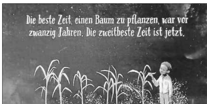
Buch „Der Junge, der einen Wald pflanzte“