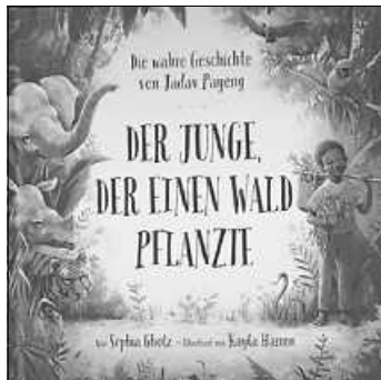
Buchcover „Der Junge der einen Wald pflanzte“

Am Freitagnachmittag, 13. September 16:30 Uhr für Kinder ab 3 Jahren: ein Buch über einen Hund, der sich bei seinem Frauchen überfordert fühlt und 17:00 Uhr für Kinder ab 5 Jahren: „Der Junge, der einen Wald pflanzte“ Das Buch erzählt die wahre Geschichte von einem Jungen, der ein paar Bambussetzlinge pflanzt, die schon bald zu einem Gebüsch heranwachsen. Fortan pflanzt der Junge fleißig jeden Tag. Plötzlich entsteht ein richtiger Wald. Schon bald geschieht ein Wunder. Es kehren Elefanten, Affen und Tiger in den Wald zurück, den der Junge pflanzte.