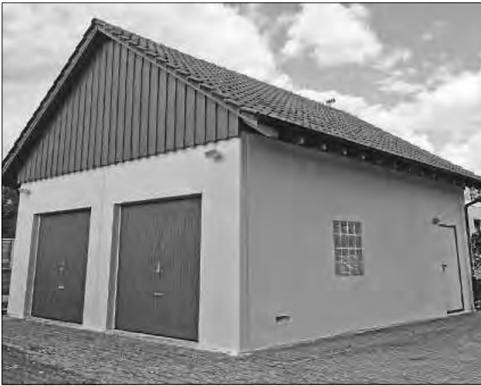
Musikvereinsmagazin im neuen Glanz