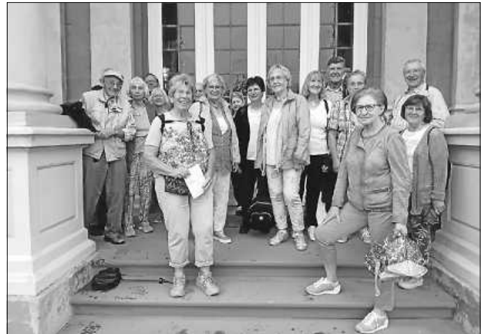
Sammeln zur Abfahrt

Kleine Musikvorführungen an den Drehorgeln rundeten den Kulturgenuss ab. Einige der Gruppe nutzen die freie Zeit zusätzlich, um sich noch ein wenig in der Stadt umzusehen oder vor dem Heimweg noch einen Kaffee zu trinken.