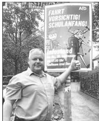
Vorsichtig Schulanfang

Um die Sicherheit unserer Kinder zu gewährleisten, haben wir in den letzten Tagen Plakate mit dem Aufruf „Fahrt vorsichtig! Schule hat begonnen!“ in verschiedenen Bereichen der Stadt aufgehängt. Diese Kampagne soll uns alle sensibilisieren, langsamer zu fahren und besonders in der Nähe von Schulen und Kindergärten aufmerksam zu sein.