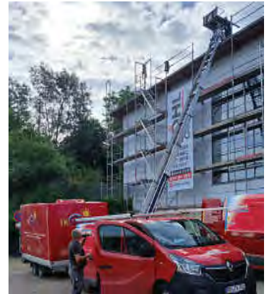
Transport der PV-Module auf das Flachdach des Kinder- und Jugendzentrums E3.

Die nächsten geplanten PV-Anlagen sind für das Dach der Grundschule Roßwälden, den Kindergarten in Bünzwangen, sowie zwei der Stadtwerke-Pumpstationen vorgesehen.