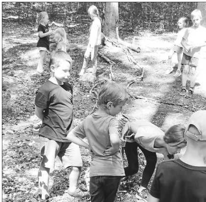
Eine gelungene Waldmurmelmahn