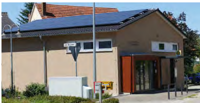
PV-Anlage mit 12,45 kWp auf dem Satteldach des Dorfgemeinschaftshauses in der Schorndorfer Straße 21 in Büchenbronn.

Bei beiden Anlagen ist noch ein Monitor zur Visualisie-