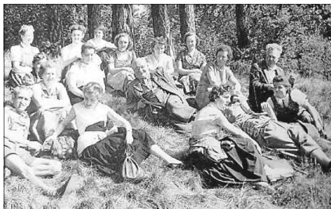
1956 Rast auf dem Wasserberg