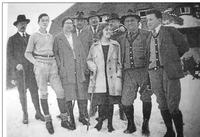
1927 vor dem Wasserberghaus