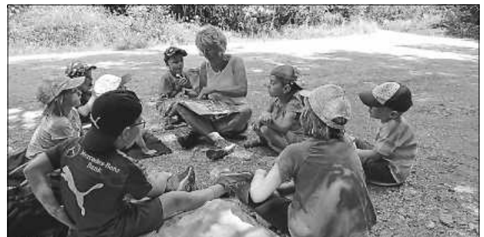
Im Schatten des Waldes ließ es sich gut vorlesen