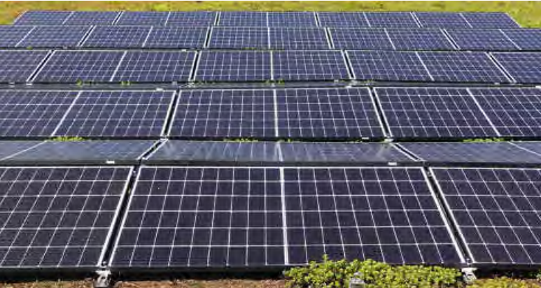
PV-Anlage mit 20,75 kWp auf dem Gründach des Kinder- und Jugendzentrums E3 in der Kanalstraße 6 in Ebersbach.