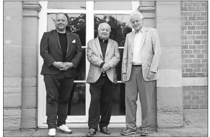
AfD Fraktion Ebersbach