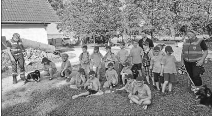
Die Minis mit der Rettungshundestaffel Mittlerer Neckar

Das klang so spannend, dass die Minis es sich natürlich nicht nehmen ließen, genau das mal höchst persönlich auszuprobieren. Dazu versteckten sich ein paar mutige Minis in dem abenteuerlichen Trainingsgelände, welches aus zerfallenen Häusern, unterirdischen Gängen, Geröll und verunfallten Autos bestand. Anschließend wurden die Hunde zur Arbeit aufgefordert, um die vermissten Kinder zu suchen. Was für ein Glück, dass alle wieder gefunden wurden und wir am Ende wieder komplett die Heimfahrt antreten konnten.