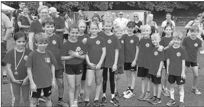
Die Leichtathleten bei der Siegerehrung