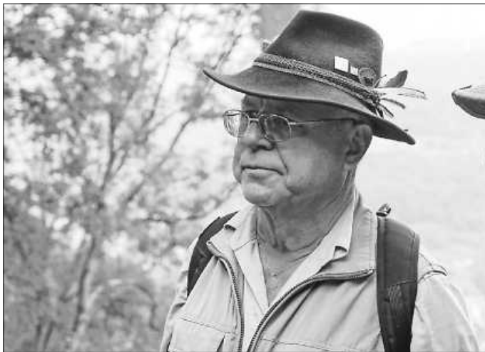
Ich warte auf euch

Einkehr: nach der Wanderung im Hasenheim Ebersbach-Fils