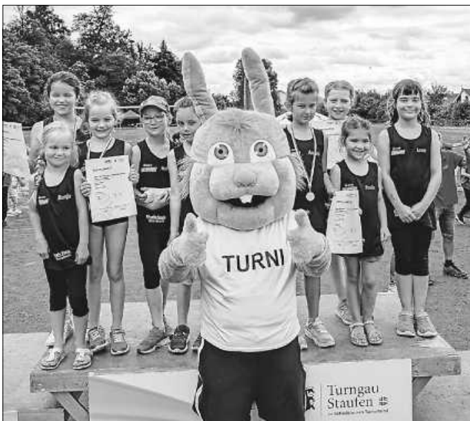
Die Turnmädchen mit STB-Maskottchen „Turni“

Dieses Jahr richtete der TV Ebersbach die Wahlwettkämpfe des Gau-Kinder- und Jugend-Turnfestes 2024 aus. Der Wettergott hatte ein Einsehen und so konnten alle Wettkämpfe im TVE-Stadion ohne Regen durchgeführt werden. Ungefähr 400 Kinder aus 17 Vereinen des Bezirks 1 zeigten ihr Können im Gerätturnen, in der Leichtathletik und beim Rope Skipping. Der TVE konnte wirklich stolz auf seine Sportler sein, denn insgesamt wurden 20 Podestplätze erkämpft: 9 Kinder bekamen eine Gold-, 8 eine Silber- und 3 eine Bronzemedaille. Das ist eine tolle Bilanz bei knapp 40 TVE-Starterinnen und -Starter! Aber vorrangig standen ja der Spaß an der Bewegung und das sportliche Miteinander im Mittelpunkt. Auch der Turngau-Flashmob wurde fleißig vor jeder Siegerehrung zu cooler Musik getanzt, sodass die Zuschauer kräftig im Rhythmus mitklopfen. Und unser Wirtschaftsteam verwöhnte unsere Gäste mit Pommes, Roter Wurst, LKW, Brezeln, Waffel und Getränken.