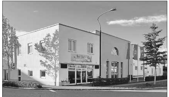
DITIB Türkisch-Islamische Gemeinde zu Ebersbach a.d. Fils e.V.

Als Vorstand der Moscheegemeinde der „Ditib Mevlana Moschee“ freuen wir uns, Ihnen unsere (womöglich schon bekannte) Gemeinde vorzustellen und Ihnen unsere Unterstützung im Rahmen des Schulunterrichts anzubieten. Seit Juli 2023 werden die Moscheeführungen von mir und unserer deutschsprachigen Theologin durchgeführt und ggf. Beiträge unseres Imams adäquat übersetzt.