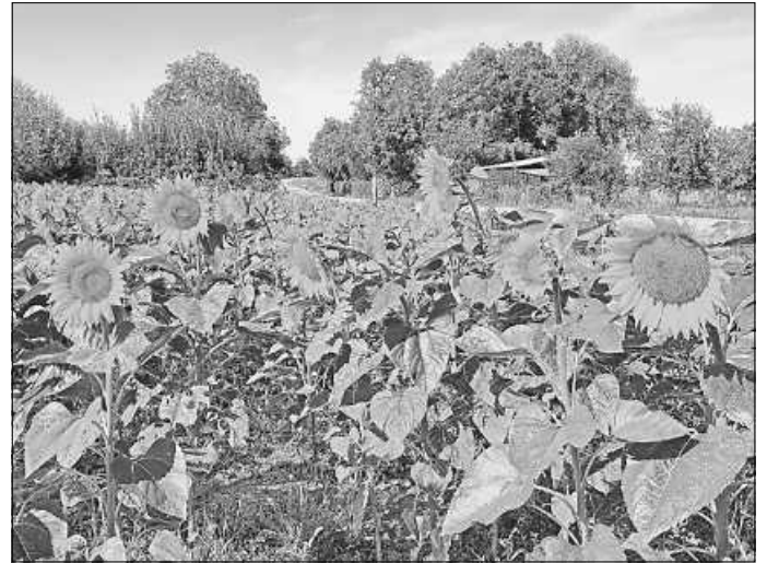
in der Nähe von Roßwälden

nach alten Bauplänen und mit alten handwerklichen Methoden und Werkzeugen am Nachbau einer mittelalterlichen Klosteranlage gearbeitet. Der Rundgang kann selbständig oder in Form einer Führung (5 Euro) erfolgen.