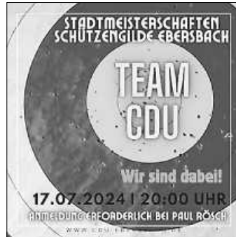
Stadtmeisterschaften Schützengilde

Anmeldung für die Stadtmeisterschaften erforderlich unter: paulroesch@gmx.net