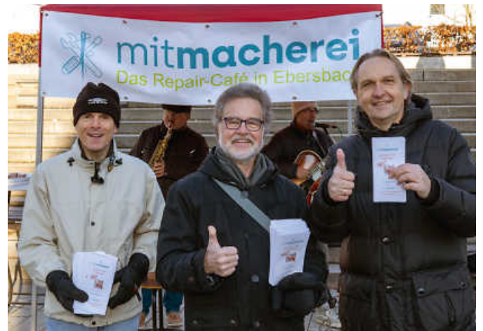
Die Initiatoren der „Mitmacherei“ freuen sich auf das nächste Repair-Café am Samstag, 6. Juli in den Seminarräumen unterhalb der Stadtbibliothek