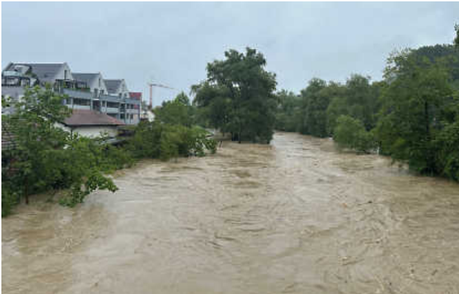
Hochwasser der Fils am ersten Juni Wochenende 2024.