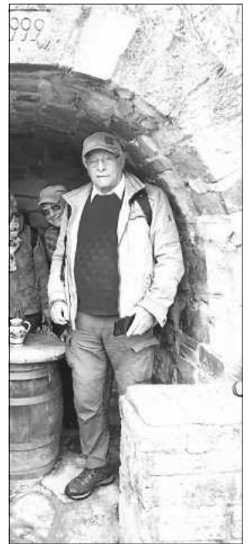
Der Wanderführer freut sich auf rege Beteiligung

Bei schlechtem Wetter können wir auch in der Schwabenhütte sitzen.