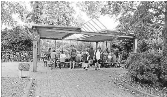
Teilnehmer der Kreiswanderfahrt beim gemütlichen Zusammensein und Erfahrungsaustausch

Am vergangenen Sonntag war Ebersbach Zielpunkt der 4. Kreiswanderfahrt. Bei idealem Radfahrerwetter fanden sich insgesamt 69 Teilnehmer an der Marktschulturnhalle ein, die dort vom Team des RMSV bewirtet wurden. Das Kuchenbuffet fand aufgrund der tollen Kuchen wieder regen Anklang. Vielen Dank an dieser Stelle an alle Helfer und unsere fleißigen Kuchenbäcker.