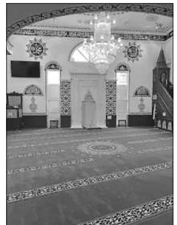
DITIB Türkisch-Islamische Gemeinde zu Ebersbach a.d. Fils e.V.