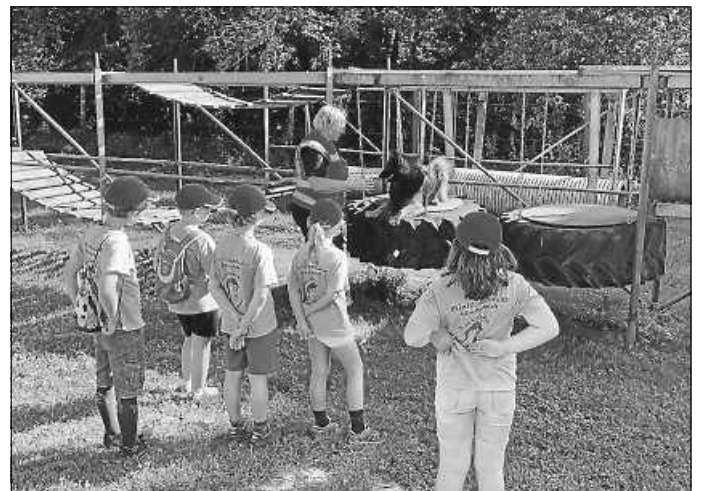
Voller Aufmerksamkeit verfolgen die Minis einen Rettungshund im Übungsparcour

Danach wurde es spannend, denn nun durften die Hunde endlich zeigen, was sie alles so draufhaben. Und das war eine ganze Menge! Hautnah beobachten wir, wie die Hunde durch enge dunkle Gänge krochen, über steile Leitern hoch und runter kletterten, über schmale Balken balancierten oder sogar wacklige Wippen, Brücken und schaukelnde Gegenstände überwunden. Einfach toll!