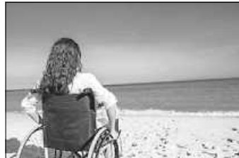
Impuls

„Gott nahm in seine Hände meine Zeit, - so dichtete der Kabarettist und Gottespoet Hanns Dieter Hüsch. Eine Leichtigkeit schwebt durch sein Gedicht, wenn er fragt „Was macht, dass ich so fröhlich bin?“ und fortfährt „Ich sing und tanze her und hin vom Kindbett bis zur Leich.“