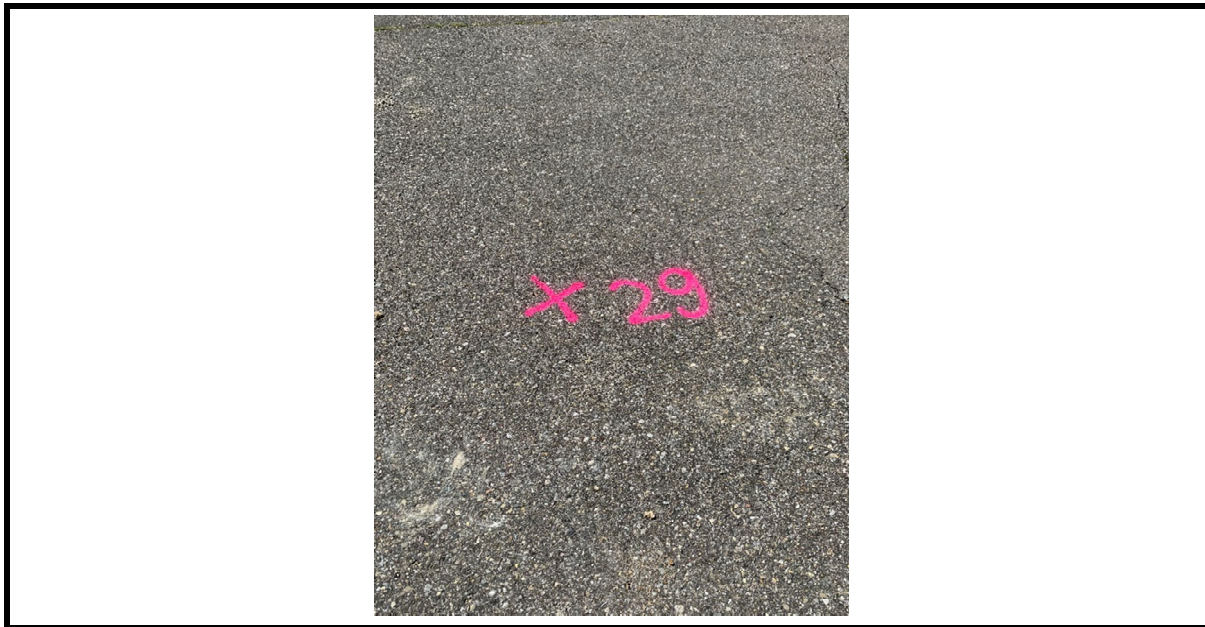
Kurzbeschreibung: Punkt 29 auf Asphalt - konnte nicht geräumt werden Aufnahmedatum: 12.07.2021