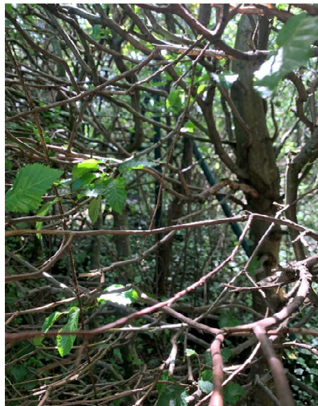
Kurzbeschreibung: Punkt 18 und 19 Zaunalage Aufnahmedatum: 12.07.2021