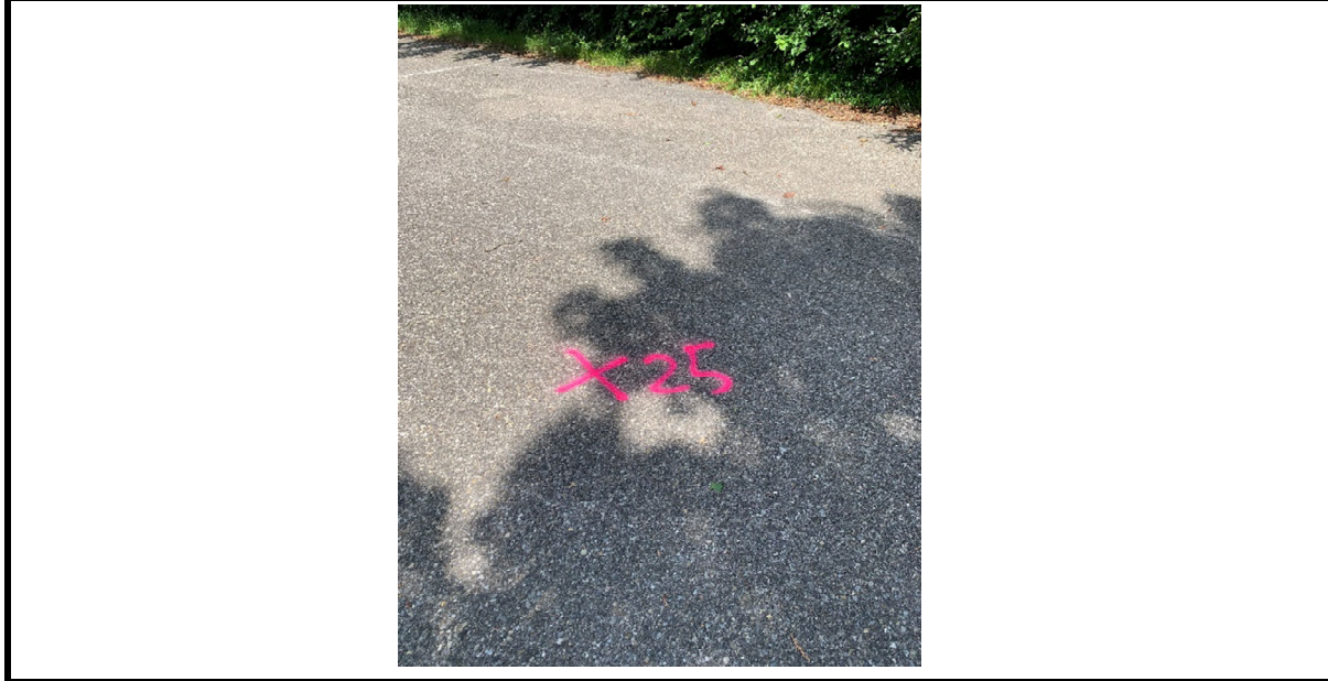
Kurzbeschreibung: Punkt 25 auf Asphalt - konnte nicht geräumt werden Aufnahmedatum: 12.07.2021