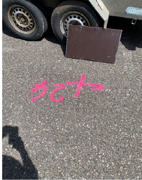
Kurzbeschreibung: Punkt 24 auf Asphalt - konnte nicht geräumt werden Aufnahmedatum: 12.07.2021