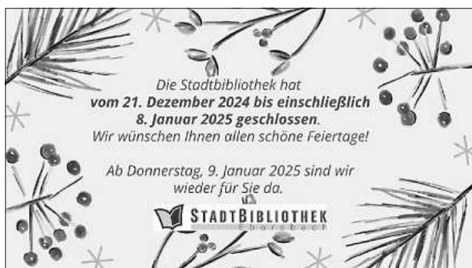
Schließzeiten Weihnachten