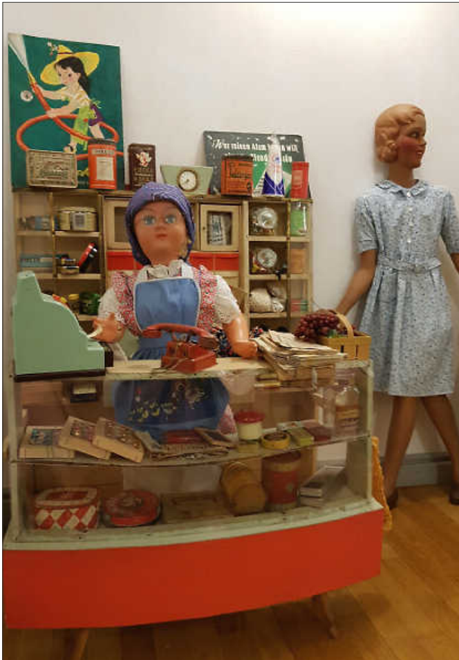
Im Ebersbacher Stadtmuseum lassen sich im Rahmen der neuen Sonderausstellung magische Augenblicke mit altem Spielzeug erleben.

Am Freitag, 22. November 2024 findet die Eröffnung der neuen Sonderausstellung im Ebersbacher Stadtmuseum Alte Post statt.