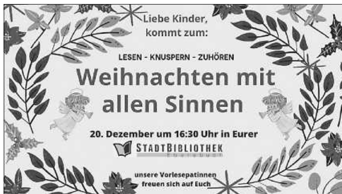
Weihnachten mit allen Sinnen für Kinder

Liebe Kinder, an diesem Tag erwartet Euch ein besonderes Vorlese-Ereignis – lasst Euch überraschen!