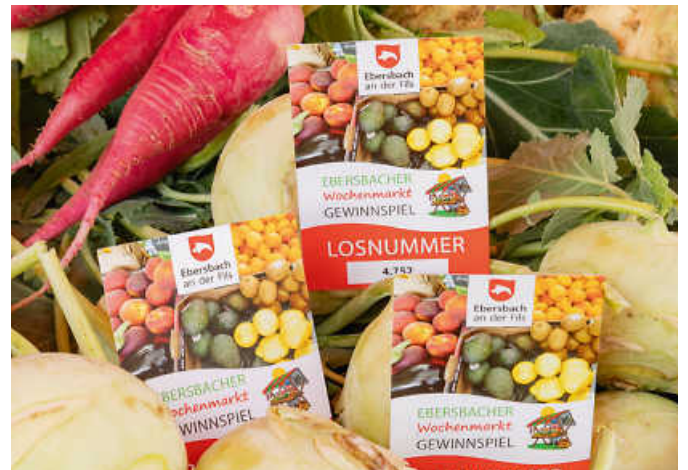
Beim Wochenmarkt am 16. November wurden wieder die beliebten Gewinnspiellose ausgegeben.