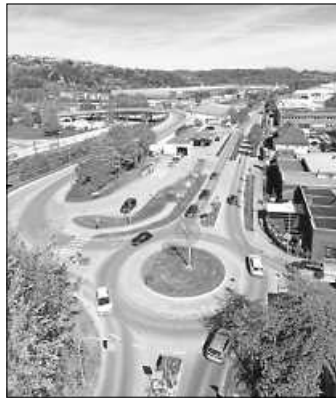
Ebersbach von oben | Kreisel Pus-teblume Foto: Lukas Nagl CDU

Gute und sichere Straßen sind lebenswichtig für unsere Mobilität und das Rückgrat unserer Infrastruktur. Sie verbinden nicht nur Stadtteile, sondern auch Menschen und Unternehmen dieser Stadt. Mit unseren Anträgen möchten wir innovative Konzepte fördern, die sowohl den Bedürfnissen der Bürger als auch den Besuchern unserer Stadt gerecht werden. Sie berücksichtigen zudem die Verkehrssicherheit. Nur so können wir Unfälle vermeiden und die Sicherheit im Straßenverkehr weiter erhöhen.