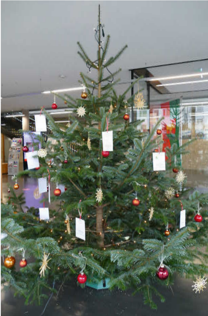
Am Weihnachtsbaum im Foyer des Rathauses befinden sich Zettel mit Weihnachtswünschen bedürftiger Ebersbacher Kinder.