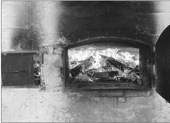
Feuer in unserem historischen Backhaus

Kurzfristige Änderungen und Ergänzungen sind jederzeit möglich.