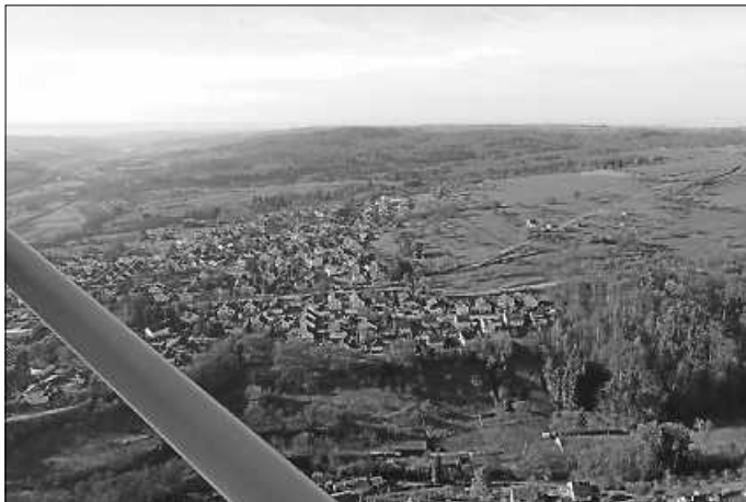
Luftaufnahme Ebersbach - Nordwest

Falls du immer schon davon geträumt hast, fliegen zu lernen, komm doch vorbei – mit uns kann dein Traum Wirklichkeit werden.