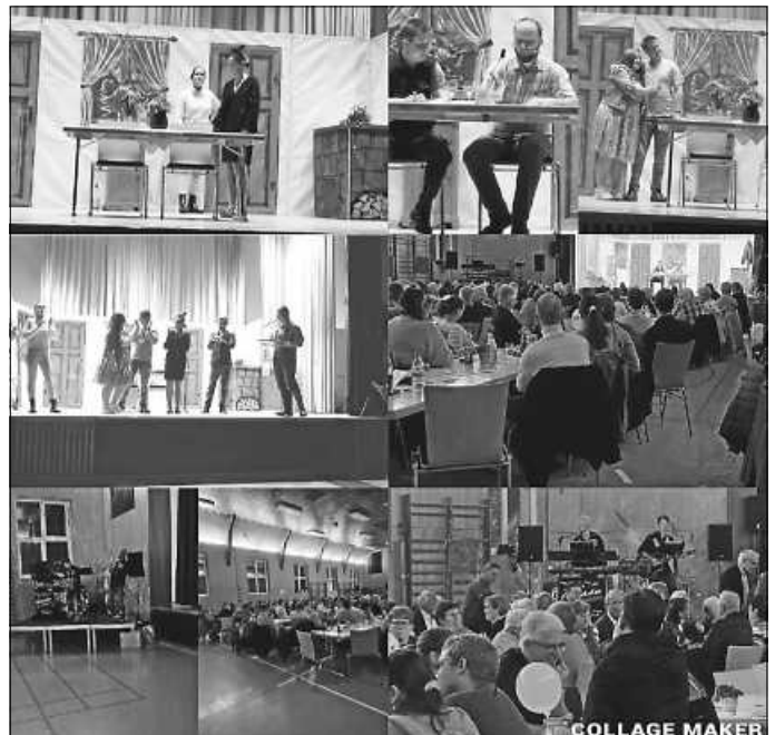
Theater und Stimmung

Alle Zuschauer spendeten einen riesigen Applaus und sind schon auf das nächste Theaterstück gespannt!